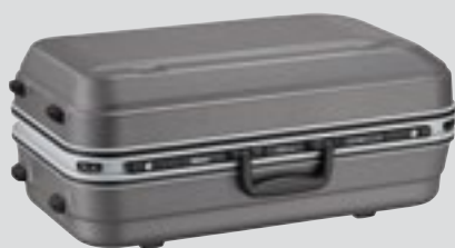
Valise CT-505 (incluse)