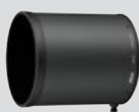
Parasoleil HK-34 (inclus)