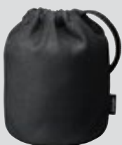
Objektivbeutel CL-1218 (optional)